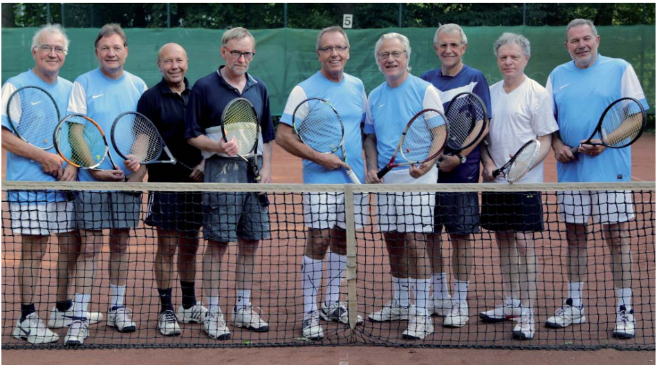
Die siegreiche Mannschaft Herren 60 II