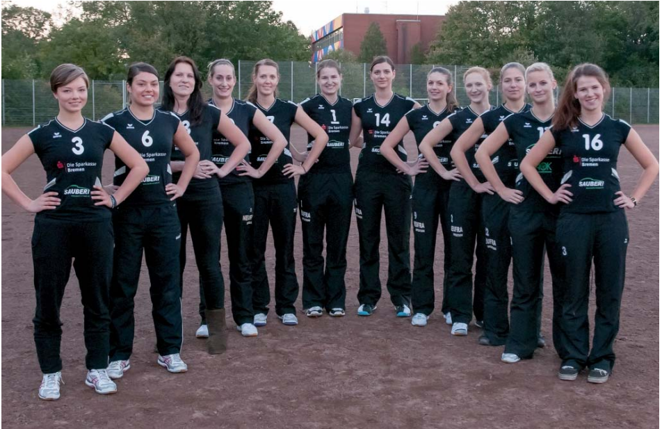
Die 1. Damen Volleyball freut sich auf die neue Saison