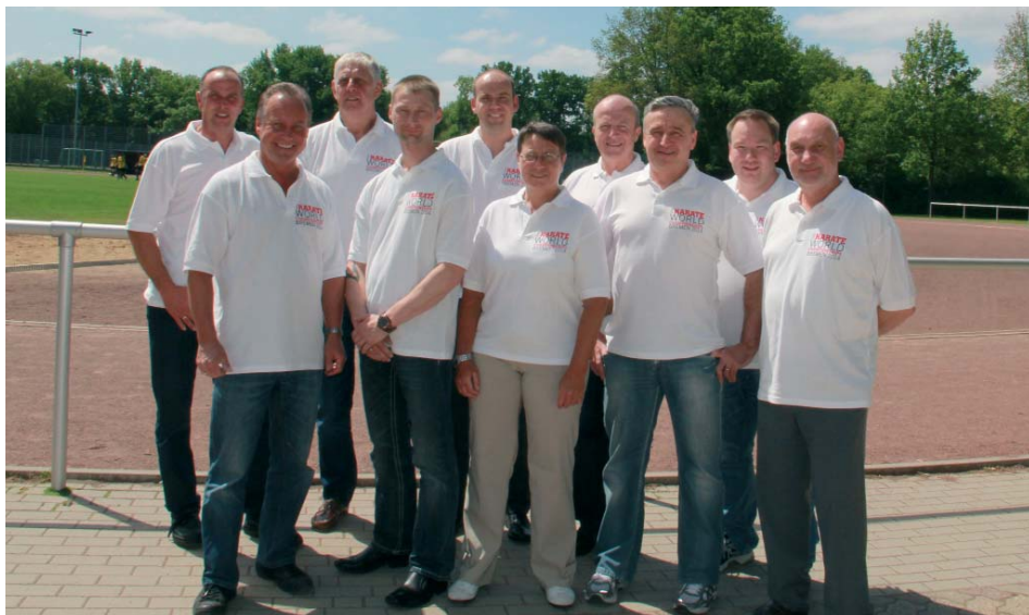
Das Organisationsteam der Karate-WM