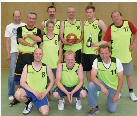
Die Sieger beim Turnier in der Neustadt