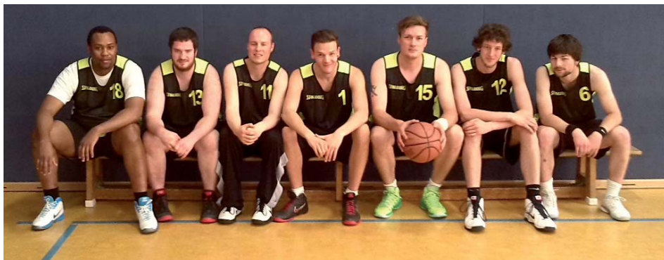
Die neuen Trikots beim ersten Einsatz - Turnier in Leer