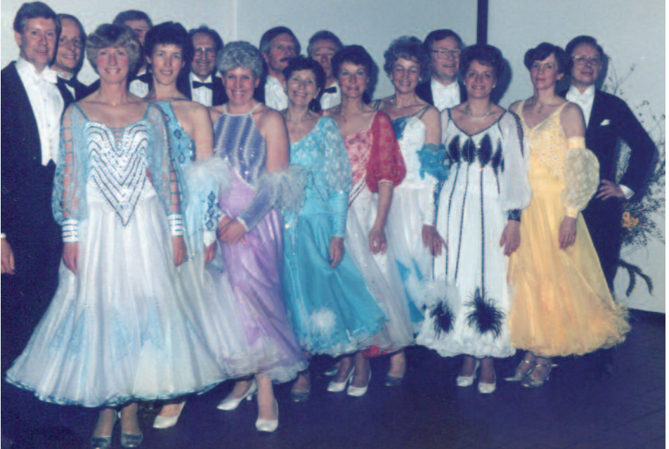
Ein Foto aus glorreichen Zeiten