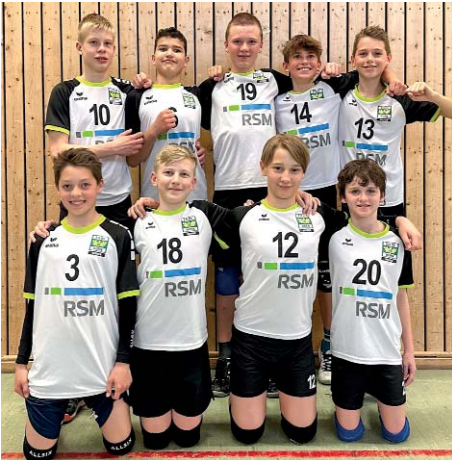
Die U14-Jungs in Dresden

Nach einem grandiosen 6. Platz bei den deutschen Meisterschaften der U14 männlich 2022 waren dieses Jahr unsere jüngeren Volleyballer dran. Ohne Probleme qualifizierten sich die Jungs wieder bei den Nordwestdeutschen Meisterschaften der Jahrgänge 2010 und jünger für die U14 DM, die vom 19.-21. Mai 2023 in Dresden stattfand.