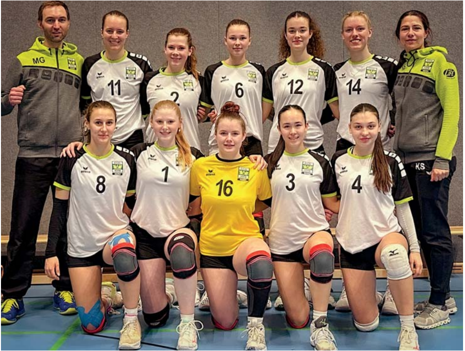
Schlagkräftiges Team auf der Deutschen Meisterschaft