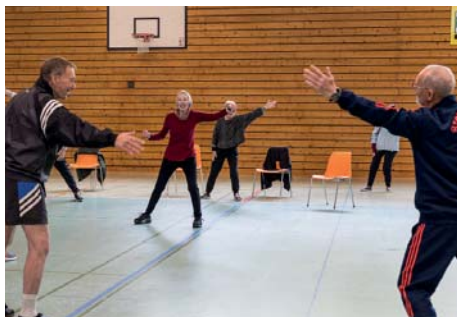
Dosierte Bewegung beim Herzsport