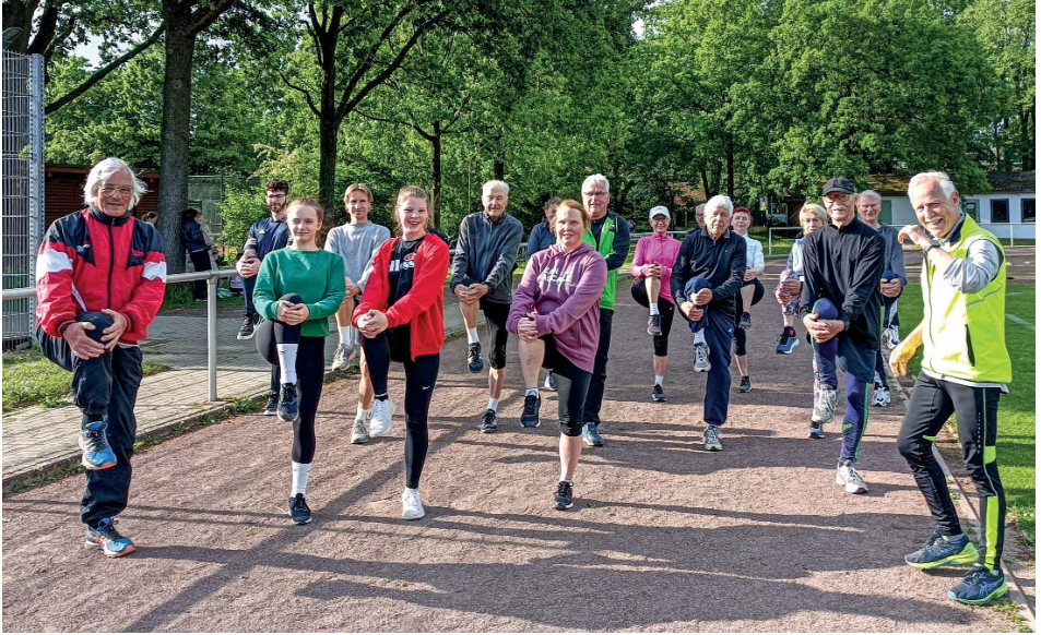
Aufwärmtraining, bevor es an die Stationen geht