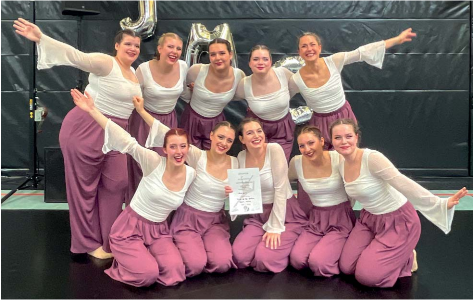
Siegerinnenehrung auf dem Turnier in Schöning