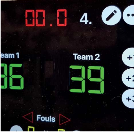
Ergebnis eines spannenden Basketball-Matches