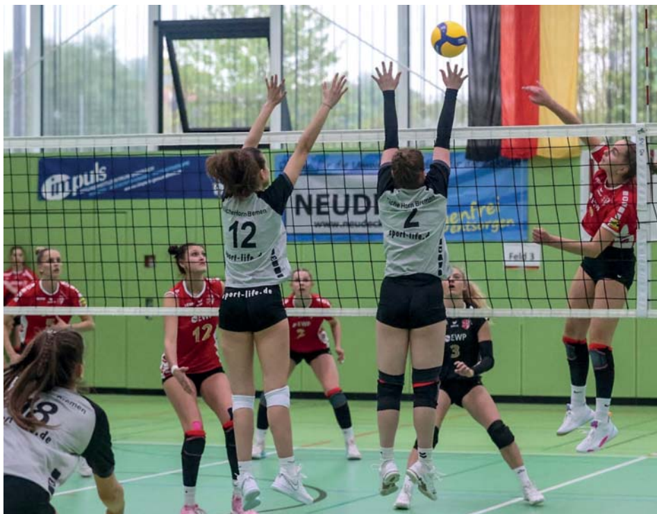
Duell am Netz