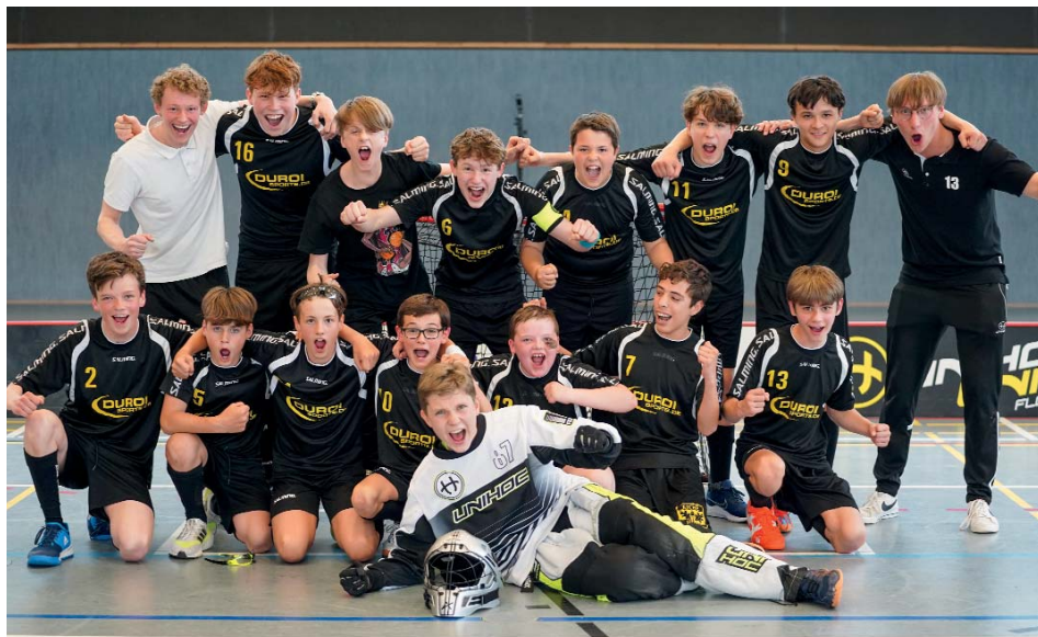
Das Jugend-U15-Team bejubelt den 6. Platz auf der Deutschen Meisterschaft