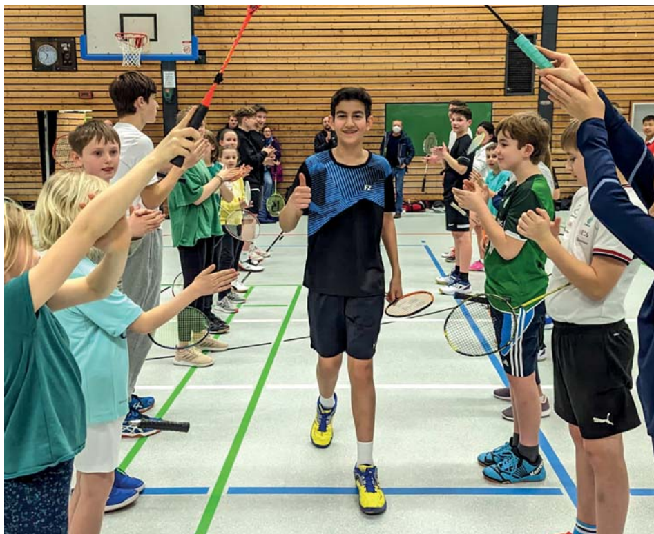
Stimmungsvolle Meisterfeier des Jugendteams