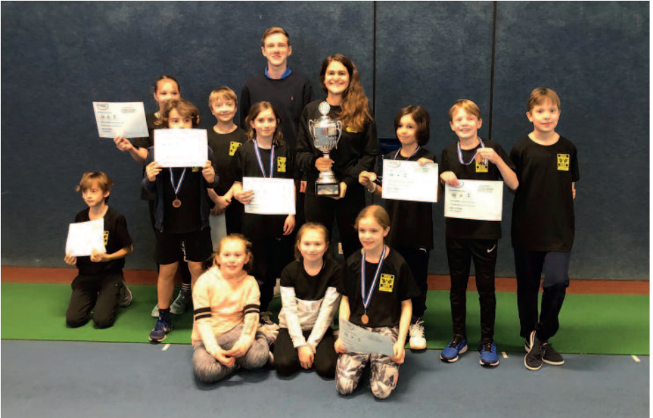
Stolze Gewinner des Staffelpokals