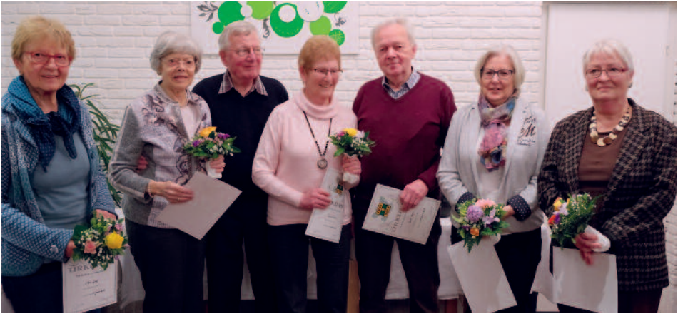
Blumen und eine Urkunde für 40-jährige Vereinstreue