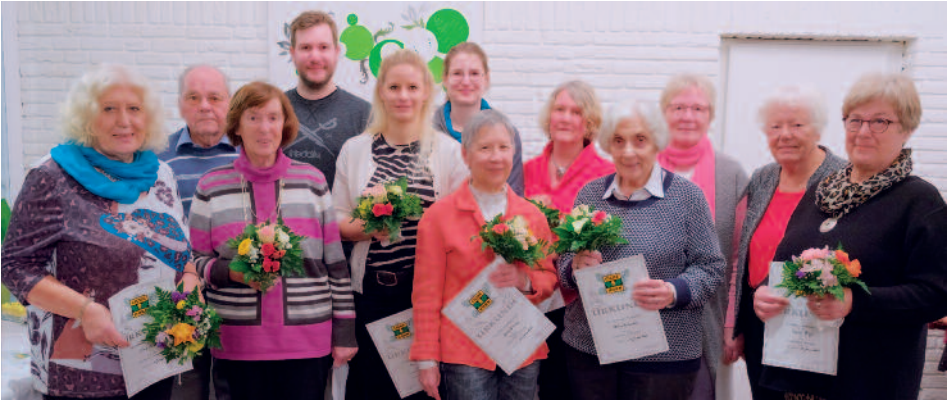
Diese Damen und Herren wurden für 25-jährige Vereinszugehörigkeit geehrt

geht nicht“, richtete Dieter Benthien den Dank und die Gratulation des Ehrenrates an die beiden Jubilare.