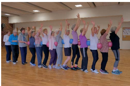
Sport und Spass