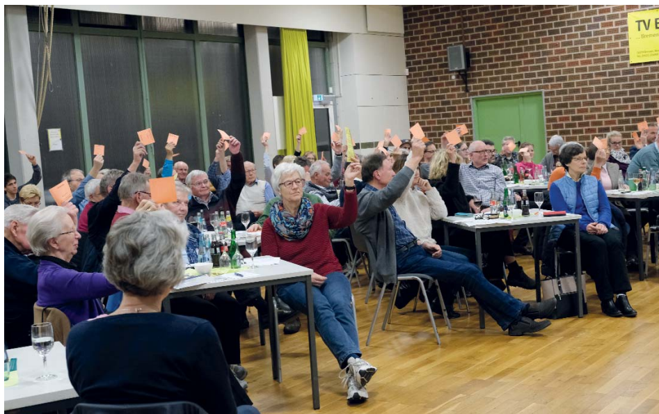
Die Delegierten geben ihre Zustimmung