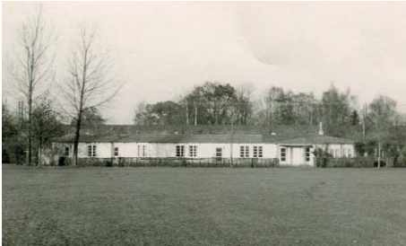
Das erste Vereinsheim

Ein Meilenstein in der Vereinsgeschichte: Es wird über die Einweihung des ersten Vereinsheims auf der Fritzewiese berichtet. Viele Mitglieder - sowie etliche Firmen - leisteten fast 3000 Stunden vom Abbau einer nicht mehr benötigten Baracke (Lüninghaus) in Woltmershausen bis zum Wiederaufbau und Einrichtung eines „schönen Heims mit Dusch- und Umkleidekabinen und einer schmucken Hausmeisterwohnung“ auf der Fritzewiese. Ein für damalige Verhältnisse großartiges Ereignis, über das unter anderem auch in der Presse eines Sportvereins in Osterholz-Scharmbeck berichtet und zur Nachahmung empfohlen wurde. Um Mitglieder