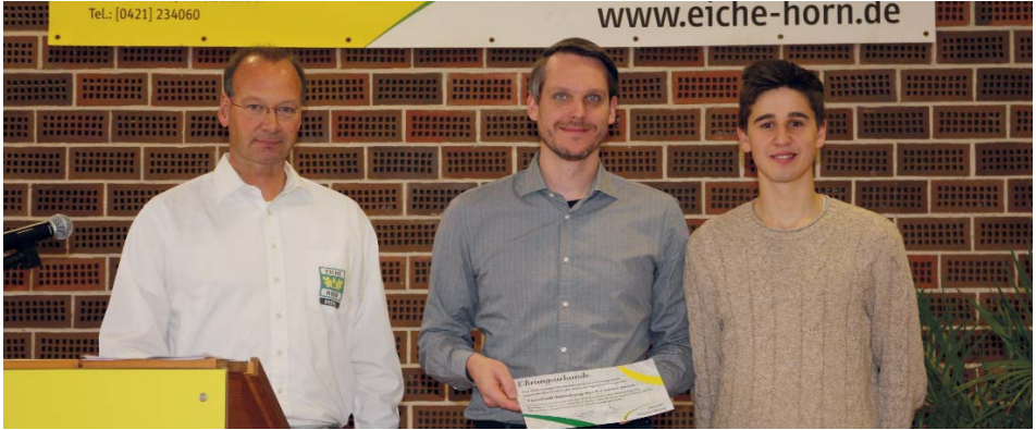
Freude bei den Floorballern