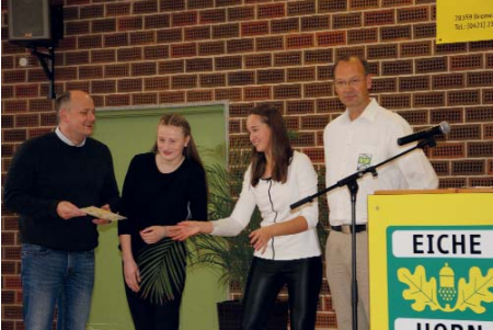
Freude bei den Judokas