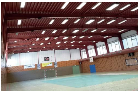
Neue Technik: hell und sparsam