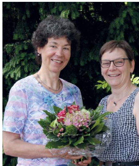
Ein Blumenstrauß zum Abschied

Bei Fragen wenden Sie sich bitte an die Geschäftsstelle des TV Eiche Horn unter Telefon 234060.