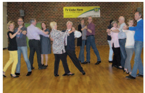
Tanzen macht Spaß und hält fit

Ein späterer Einstieg ist auch noch möglich, wenn die Teilnehmerzahl es zulässt. Immer sonntags von 17.00 Uhr bis 19.00 Uhr im Sportzentrum des TV Eiche Horn. Falls Sie Fragen zu den Tanzkreisen haben, steht Ihnen unser Team der Tanzsportabteilung unter der Telefonnummer 0421/239206 zur Verfügung.