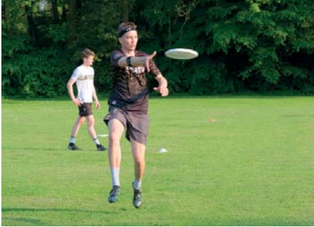
Frisbee auf der Fritzewiese