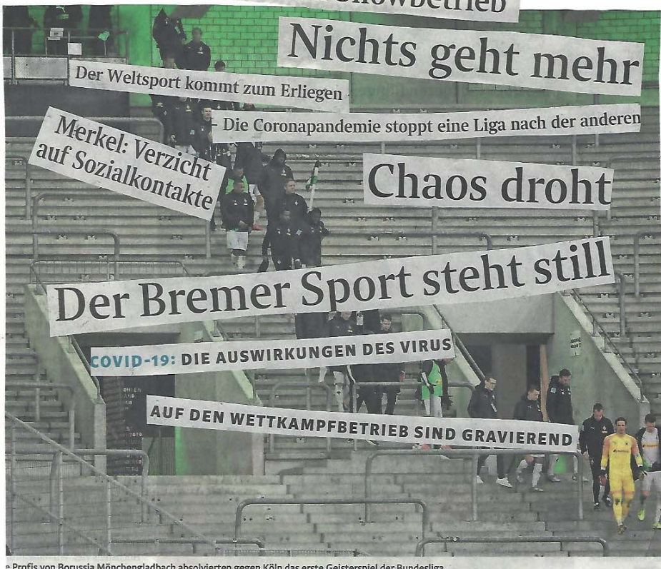
Profis von Borussia Mönchengladbach absolvierten gegen Köln das erste Geisterspiel der Bundesliga.

AUF DEN WETTKAMPFBETRIEB SIND GRAVIEREND