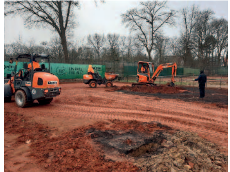
Der alte Belag wird abgetragen

tonnenweise Material für die neuen Plätze anzuliefern. Man musste die LKW-Fahrer bewundern, wie sie gekonnt auf engem Raum mit den übergroßen Fahrzeugen rangierten! Gut, dass wir vereinseigene Lagerplätze für das Material bereitstellen konnten, sonst wäre dies zum Problem geworden. Am nächsten Tag begann bereits der Aufbau des neuen Belages. Eine graue Tennis Force-Basisdecke wurde aufgetragen und gewalzt und war fester Untergrund für die neue frostsichere rote Tennis Force-Schicht. Neue Netzpfeiler wurden einbetoniert und nachdem zum Schluss die Flächen mit einer dünnen Ziegelmehlschicht abgestreut wurden, waren die beiden Ganzjahresplätze fertiggestellt.