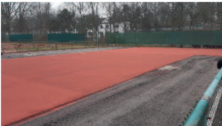
Neuer Belag mit grauer Unterschicht