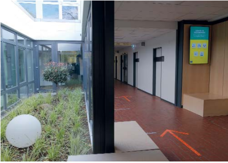
Herzlich willkommen im 'neuen Sportzentrum'