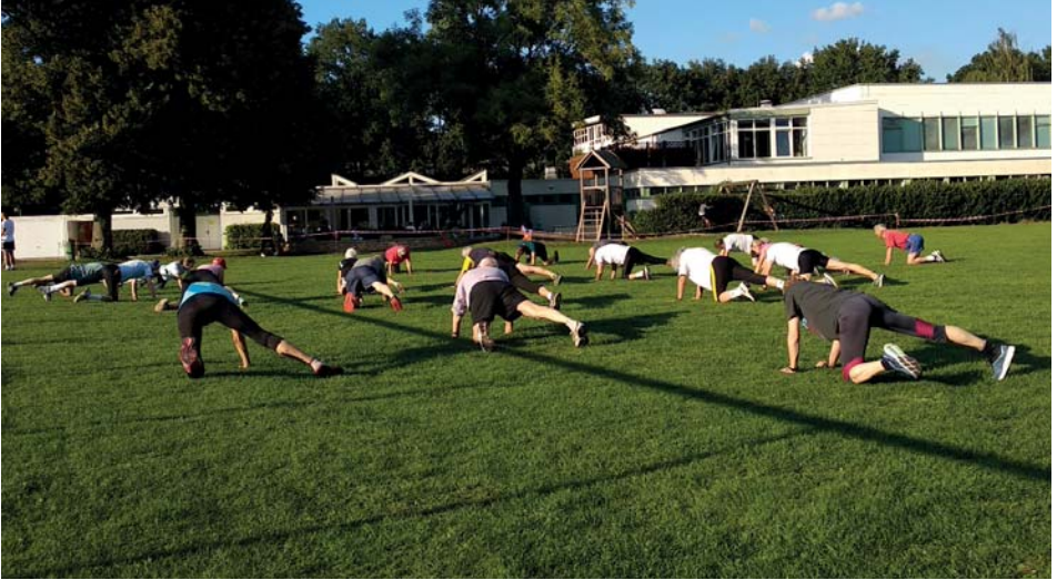
Aufwärmen für das Sportabzeichentraining