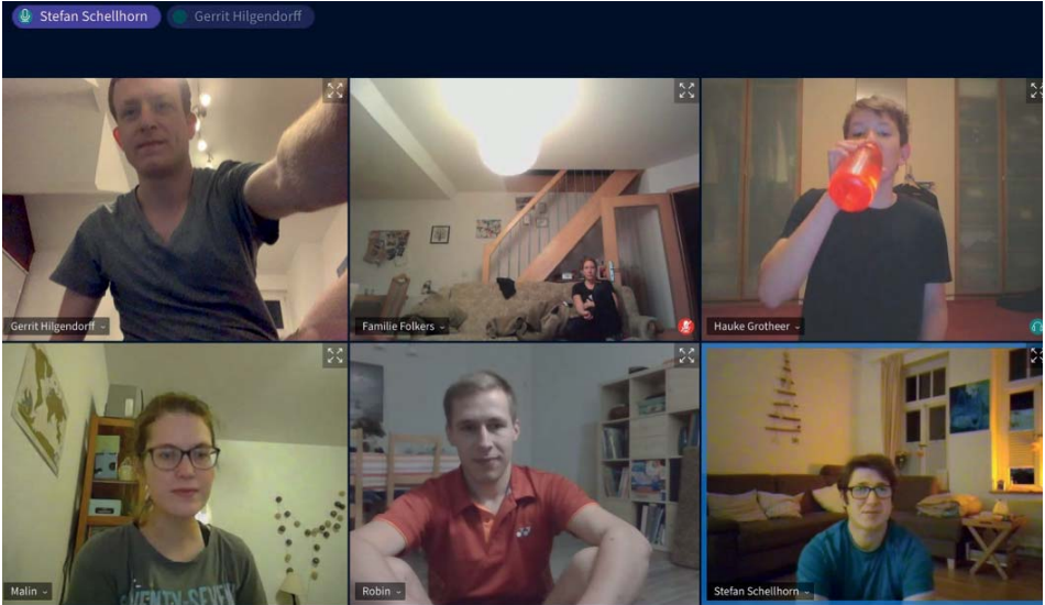
Badmintontraining per Videoschalte