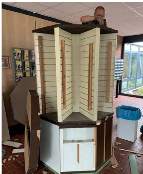
Überraschung! Das Innenleben der Litfaßsäule

Der Eingangsbereich unseres Vereins hat damit ein neues Gesicht bekommen. Die mit hellem Holz getäfelten Wände und die anthrazit lackierten Türen und Fensterrahmen als Kontrast dazu geben dem Raum ein freundlich einladendes Ambiente. Moderne Quader aus Holz laden anstelle des