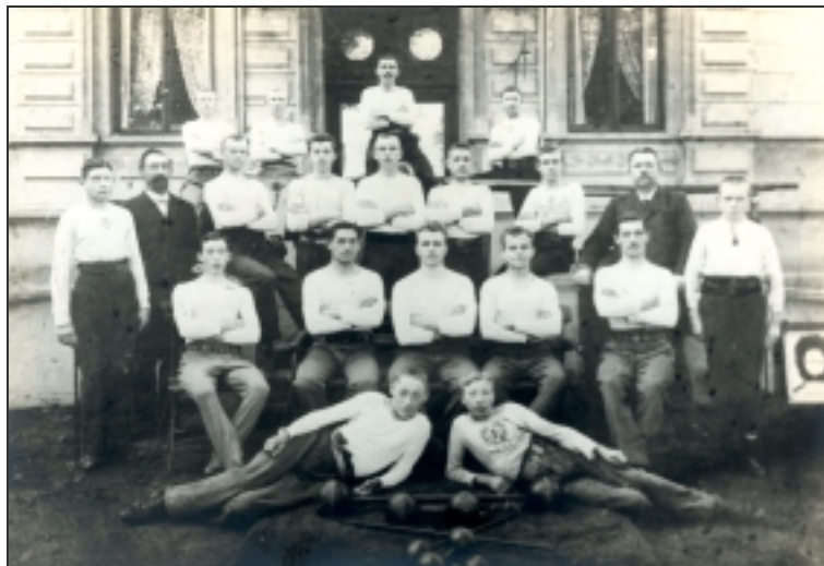
Turner des TV Eiche Horn vor dem St. Pauli-Restaurant (1901)

Gründung der Abteilung Wandern . Pfingsten erfolgt die erste Wanderung nach Immer. Abmarsch ist um 5 Uhr morgens vom Vereinslokal.