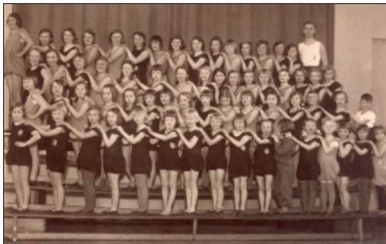
Turnen steht auch bei den Mädchen hoch im Kurs (1932)

Am 13. Nov. findet das erste Schauturnen der Jungen und Männer statt und am 20. Nov. das der Mädchen und Frauen. Beide Veranstaltungen werden in der Schulturnhalle in Horn durchgeführt. Diese Veranstaltungen werden beim TV Eiche Horn zur Tradition und finden danach fast jährlich statt.