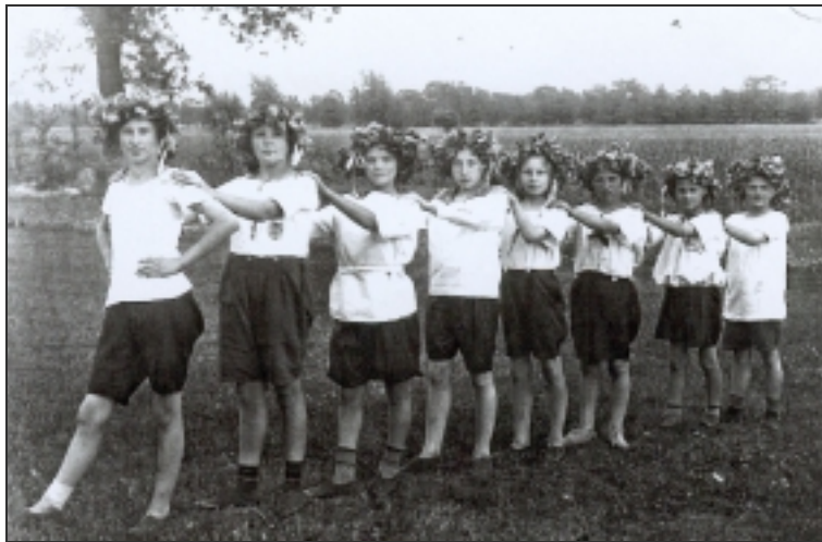
Die erste Mädchenriege des Vereins (1919)

Das „Kochskamp“ genannte Grundstück liegt an der Horner Heerstraße zwischen Klattendiek und Wätjenschloß (heute Alten Eichen). Da der Inhaber des Wätjenschlosses aber die Wohnqualität durch die Anlage eines Spielplatzes gefährdet sieht, wird nach Verhandlungen zwischen den Erben und dem Bremer Senat der Kochskamp verkauft. Mit dem Erlös werden mit insgesamt 20 Morgen erheblich größere und besser geeignete Grundstücke auf der anderen Seite der Schwachhauser Heerstr. gekauft (eines davon erst nach einem Enteignungsverfahren). So kommt die Fritzewiese an die Berckstraße .