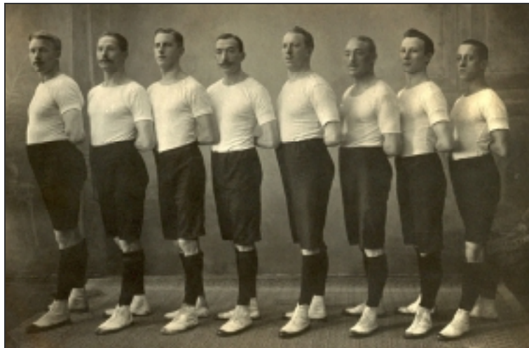
Musterriege des TV Eiche Horn (1913)