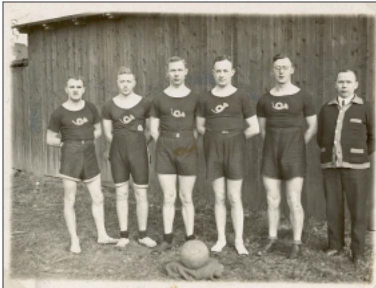
Die 1. Faustballmannschaft mit neuem Vereinszeichen (1926)

Die neuen Vereinsabzeichen sind fertiggestellt.