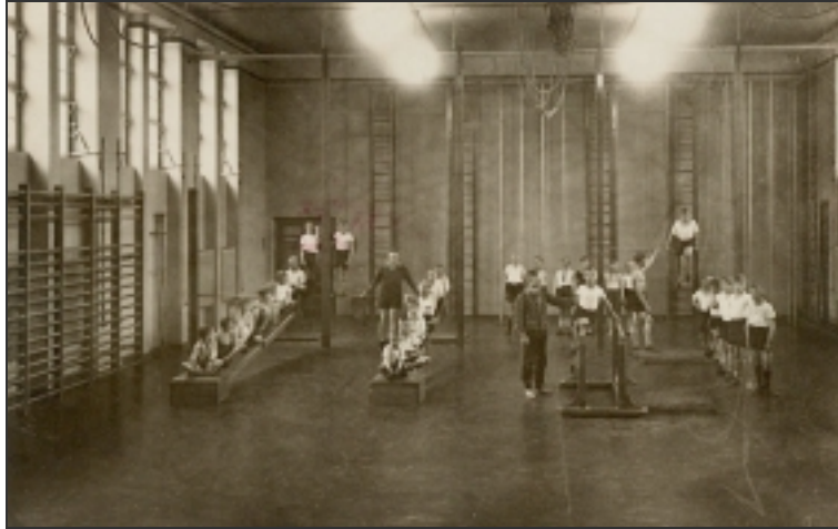
Jungenturnen in der neuen Turnhalle (1929)

Neben dem TV Eiche Horn ist auch der Arbeiter-TSV Schwachhausen-Horn Mitnutzer dieser Halle. Beide Vereine verstehen sich zu dieser Zeit recht gut, so dass es keinerlei Schwierigkeiten gibt. Spiele und Leichtathletik, Volksturnen genannt, werden auf dem Platz an der Berckstraße betrieben.